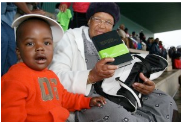
一名婦人及其孫兒手持最新出版的恩德貝萊語聖經

除了教會領袖、翻譯人員及聖經公會的代表外，一些政府要員及社會名流也出席是次的發布會。一名普馬蘭加省政府的代表認為，聖經在建立國家方面起了很大的作用，聖經的教導確保人民持守正確的道德價值觀，並成為日常生活的指南。